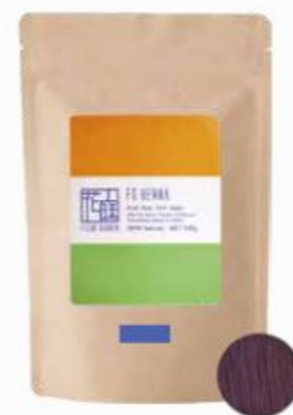
フルールガーデン ナチュラルブルー 500g