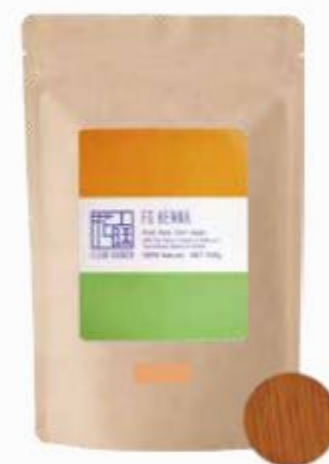
フルールガーデン ナチュラルオレンジ 500g