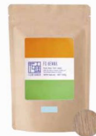
フルールガーデン クリアハーブトリートメント 500g