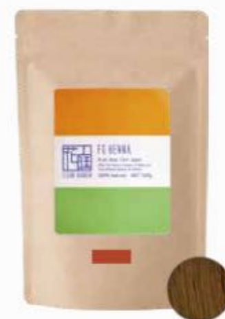
フルールガーデン ナチュラルブラウン 500g