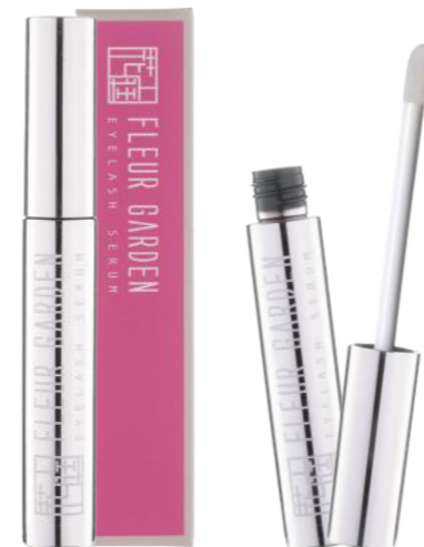
フルールガーデン アイラッシュセラム <まつ毛美容液> 5ml

フルールガーデンアイラッシュセラムをさっとひと塗りするだけで、明るく健康的で若々しい目元へと導きます。