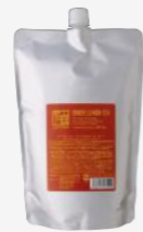
ジンジャーレモン