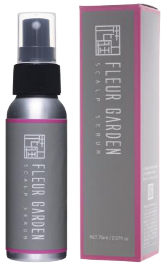
フルールガーデン スカルプセラム <頭皮用美容液> 76ml