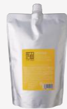
グレープフルーツ